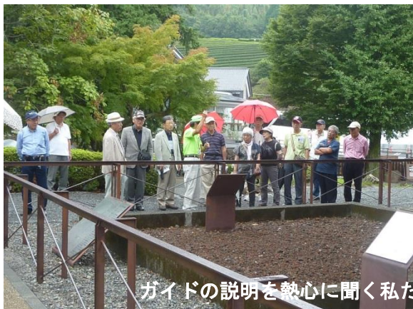
ガイドの説明を熱心に聞く私たちと铸造された大砲のレプリカ